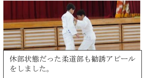
休部状態だった柔道部も勧誘アピールをしました。