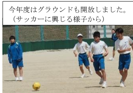
今年度はグラウンドも開放しました。(サッカーに興じる様子から)