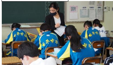
授業参観の風景から