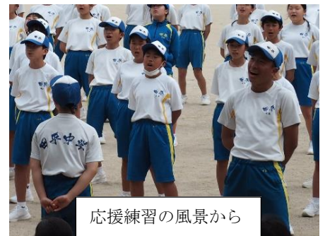
応援練習の風景から

スローガンを「百花繚乱〜咲き乱れる個性〜」と掲げています。文字どおり、一人一人の個性が結実するが如く、精一杯の走りやダンスを披露します。