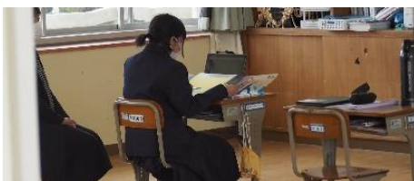
タブレット端末の特長を生かした リモート学習の様子も公開しました。

今後も、学校行事の参観とは別に、少なくとも学期に数回は座学を中心とした授業参観を開催するつもりです。どうぞ、この機会をとらえて、ご参観いただければありがたいです。ちなみに次回は6/28(水)道徳科授業の公開を予定しています。