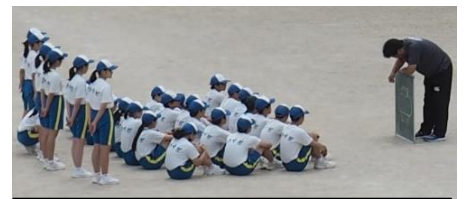
屋外(運動場)での学習の様子も公開 しました。