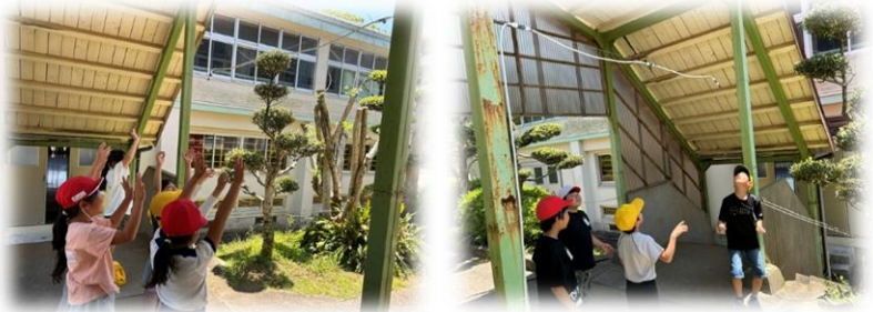
ミストシャワーを設置しました

一日一日の積み重ねを大切にしながら、子どもたちが安心して学び、成長できる学校づくりに努めてまいります。今月もどうぞよろしくお願いたします。