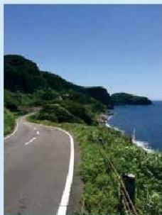
サンセットウェイ