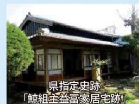
県指定史跡 「鯨組主益富家居宅跡」 ※当日は、特別に観覧できます。

方倉公園 C.P. 🗨️ 🚻 開設時間 10:15 ~ 13:30 🍴 18-30km 昼食会場