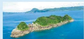
世界文化遺産 長崎と天草地方の潜伏キリシタン関連遺産 「中江ノ島」

13日(日) スタート/ゴール 生月町開発総合センター 🗨️ 🚻 ゴール 開設時間 17:00まで 🍴 8km 昼食会場