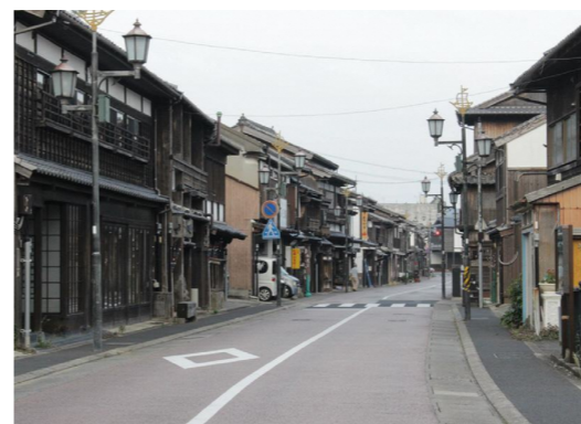
旧城下町商店街の街並み

市長 就任以降、各担当部署から政策の進捗状況や懸案事項などの説明を受けているが、人口減少や少