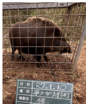
捕獲されたイノシシ

議員 イノシシ対策に市が本腰を入れて取り組むこと。その捕獲促進の対策として鳥獣対策再資源化施設設置の取り組みを求める。