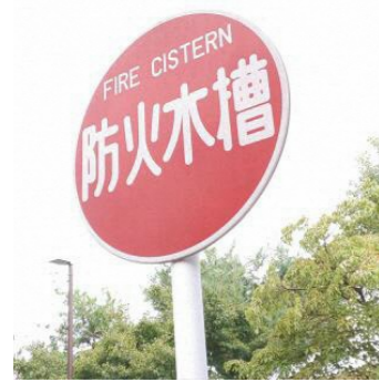
防火水槽の標識(例)

議員 ふるさと納税を活用して消火栓ボックスが整備されたが、老朽化し交換が必要なものが見受けられる。交換は、自治会負担ではなく、行政の負担で行ってほしい。 消防長 設置から十年を経過し、潮