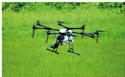
スマート農業のイメージ

議員 中部地区にこれまでであった乗り合いタクシーが廃業になり、お年寄りなど交通弱者の皆さんが移動の不便さを非常に感じているが、どう取り組むのか。