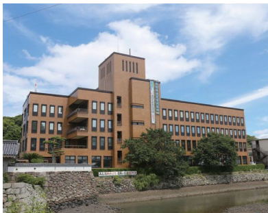
平戸市役所本庁舎

農林水産部長 猟友会と連携して有害鳥獣対策実施隊を市の特別職員と位置付け対策に当たっている。今後必要であれば増員も検討したい。また、捕獲活動の一助を担える捕獲隊を結成しているところもある。今後はこれを拡大し、捕獲体制の強化に取り組まなければならないと考える。