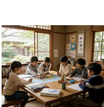
ともに学ぶ子どもたち

福祉部長 必要に応じ、こども未来課が教育委員会と共通認識を持ち、支援の方向性を検討するなど、連携を図っている。