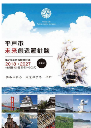
平戸市総合計画(概要版)

市長 市の財政状況などを考えると、事業の見直しや経常経費の削減が必要である。現状では困難であるが、地域振興は重要であるため、既存の体制の中で出来る限りの取り組みを進めたい。