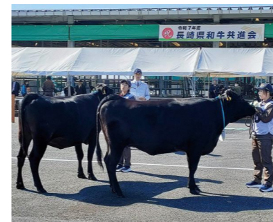
平戸市の代表牛の審査

議員 全国和牛能力共進会を見据えた取り組みと平戸和牛の振興を担う行政としての意気込みは。 農林水産部長 生産者を含めた関係機関とのチーム会議により、巡回指導を強化し、候補牛の確保育成に取り組み、全国和牛能力共進会での日本一奪還を目指したいと考えている。