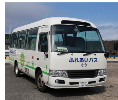
平戸市ふれあいバス

総務部長 田平町に事務所を置くタクシー事業者が中部地区の市民病院に2台常駐していたが、利用者が少なく採算に合わず、現在1台が常駐している。 議員 中部地区で自由に移動できる手段はないのか。 総務部長 平戸市ふれあいバスのデマンドバス(事前に電話やアプリで予約し、バス停や自宅まで迎えに来てくれるバス)を、月曜日から土曜日の午後1時30分から午後6時まで運行している。 ※事前の利用登録と乗車前日までの予約が必要。