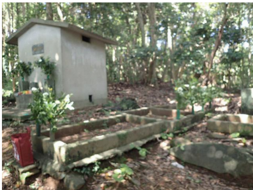
無縁仏の納骨堂(大久保町)

議員 市営住宅の配置においては、無配置となる地区を無くした地域割りを考えていただきたい。