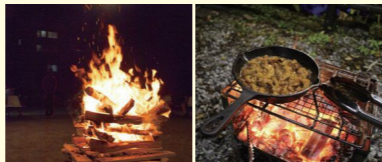
キャンプファイヤー キャンプ場での屋外調理