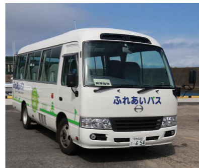
平戸市ふれあいバス

議員 中部地区で自由に移動できる手段はないのか。 総務部長 平戸市ふれあいバスのデマンドバス(事前に電話やアプリで予約し、バス停や自宅まで迎えに来てくれるバス)を、月曜日から土曜日の午後1時30分から午後6時まで運行している。 ※事前の利用登録と乗車前日までの予約が必要。