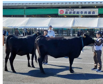
平戸市の代表牛の審査

農林水産部長 生産者を含めた関係機関とのチーム会議により、巡回指導を強化し、候補牛の確保育成に取り組み、全国和牛能力共進会での日本一奪還を目指したいと考えている。