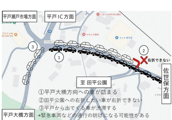
平戸大橋渋滞&田平公園入口関連資料

議員 近年のパワーハラスメントは、世代間の価値観の変化や意識の多様化が背景にあると言われている。根絶は一朝一夕には達成できないが、全庁挙げた取り組みを着実に進めていく。