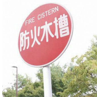
防火水槽の標識(例)

議員 ふるさと納税を活用して消火栓ボックスが整備されたが、老朽化し交換が必要なものが見受けられる。交換は、自治会負担ではなく、行政の負担で行ってほしい。