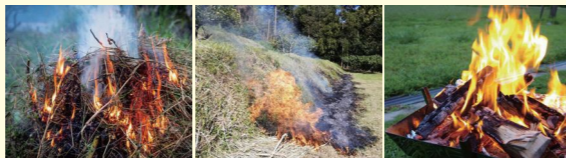
小枝・枯れ葉の焼却 麦わら・あぜ草の焼却 たき火