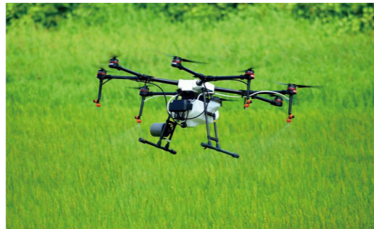
ドローンでの農業散布