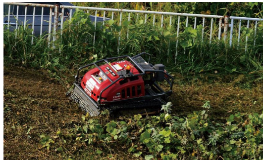
リモコン式自走草刈機

年度ごとに途中加入も可能な制度であるため、改めて各協定に対して丁寧に説明を行い、できるだけ多くの協定がスマート農業加算に加入してもらえよう努めていく。