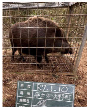
捕獲されたイノシシ