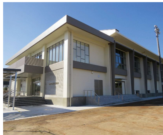
南部市民屋内運動場(1月13日時点※完成前)

南部市民屋内運動場整備事業の工事費について、1,460万円ほど増額補正となるもの。