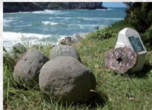
神社境内に置かれている「ちから石」。春日公民館駐車場から徒歩5分のところにある。