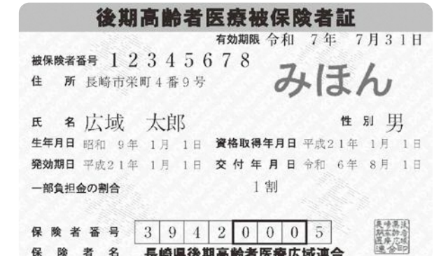
▲後期高齢者医療被保険者証の見本(オレンジ色) ※黄色の封筒で郵送します