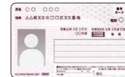
マイナンバーカード