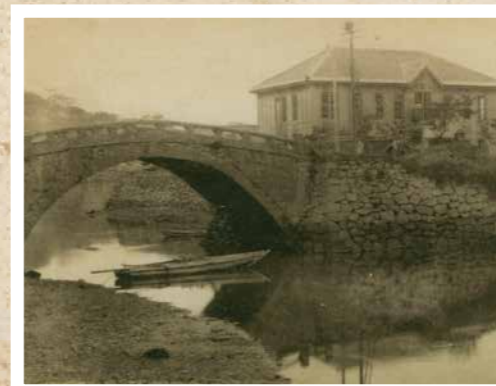
大正11年ごろの幸橋

安全な水を届ける水道事業 現在、平戸・生月・田平・大島地区の水道施設は、総勢28人の水道局職員で管理・運営しています。 生活に欠かせない水道水を、市内各地へ安定して送り届けるためには、たくさんの費用がかかります。水道事業経営にかかる費用の大部分は、市民の皆さんの貴重な水道料金で賄っています。(独立採算制) 100年後の安定供給へ 令和5年度、脱炭素化と経費削減のため、一部施設の照明をLED化しました。今後は、高効率電動機の導入など、持続可能な社会を実現するための施策に取り組めます。 また、漏水事故や災害が起きると長期の断水が発生する恐れがあるため、災害に強い水道施設を指して水道施設の建設や改良、更新を計画的に行います。