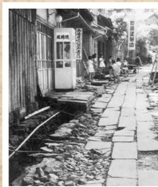
昭和30年前後の延命町通り