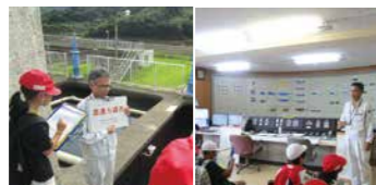
水道局施設管理班 ☎22-3838