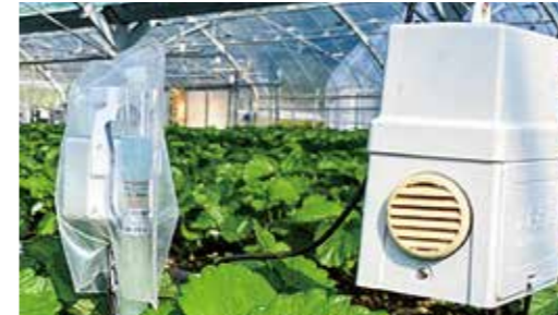
▲令和4年度導入いちごハウス環境測定機器