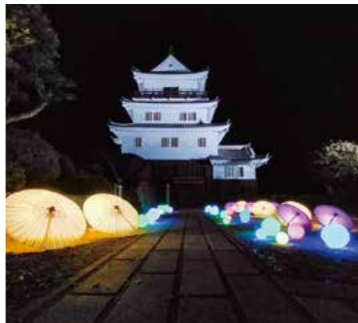
▲令和4年度ナイトミュージアム事業