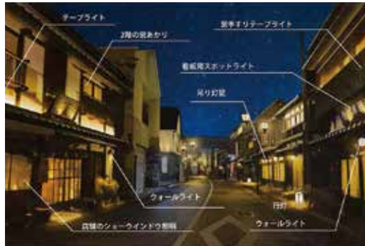
▲あかりを魅力的に活用したまちなみのイメージ