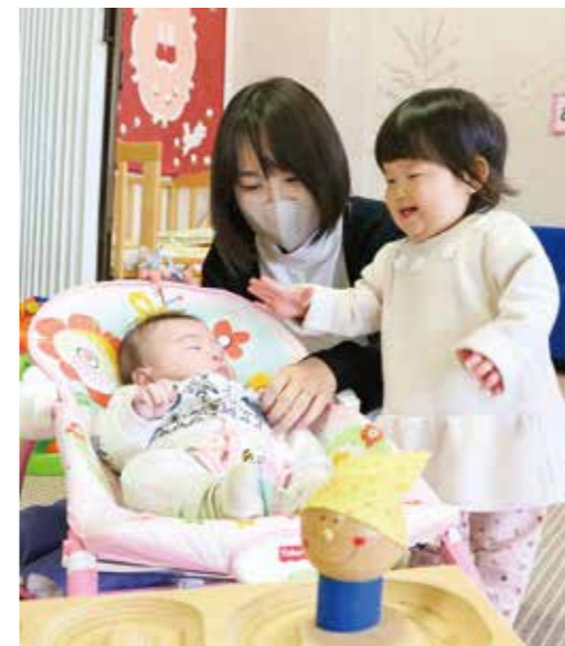
▲子育てひろばトコトコで利用者の皆さんの子どもたちがふれあう様子