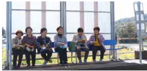
▲バスを待つ「高齢者いきいきおでかけ券」利用者の皆さん