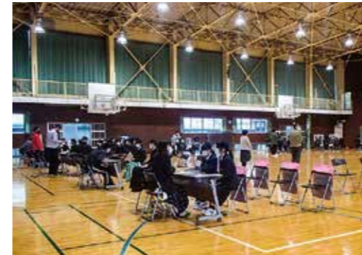
▲令和4年度合同企業説明会の様子