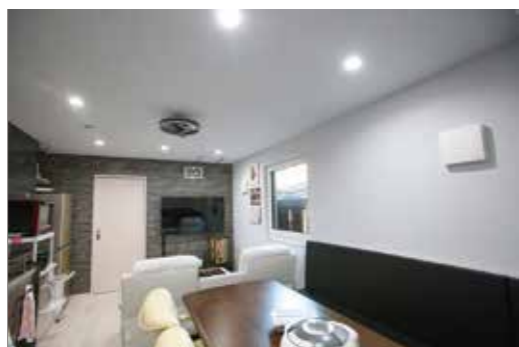
▲女性向けの快適なシェアハウスを手がける