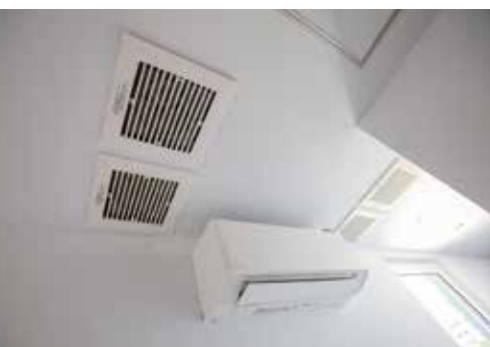
▲エアコンは1軒に1台で充分