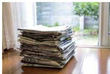
古紙類など→地域の集団回収などへ