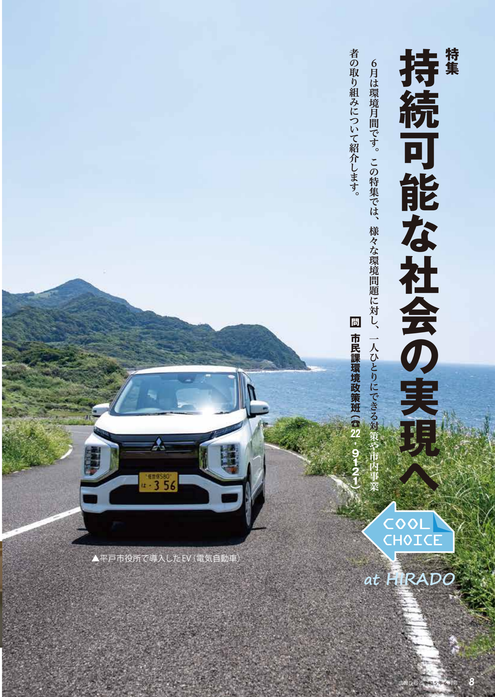
▲平戸市役所で導入したEV(電気自動車)