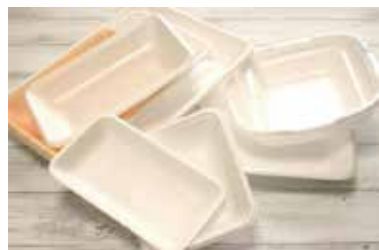
食品トレー→スーパーなどの回収ボックスへ