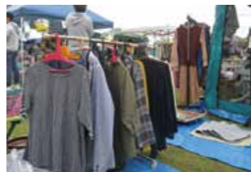
衣類→リサイクルショップやフリマアプリなどへ