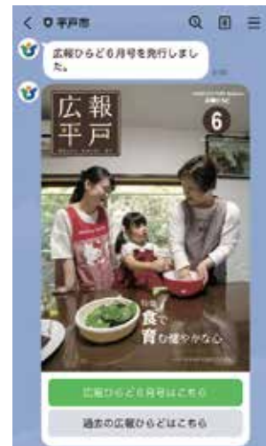
▲広報ひろども毎月配信