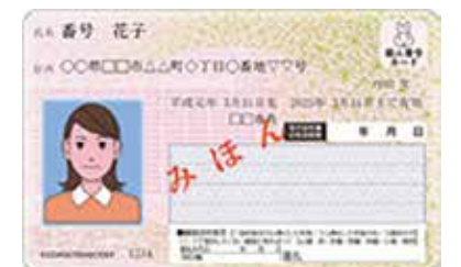
▲マイナンバーカードの見本