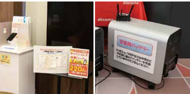
▲便利なスマホでのキャッシュレス決済を体験できます。

また、自治会や老人クラブなど、各地域の団体の要請に応じて、出張スマホ教室も開催していますので、お気軽にご相談ください。