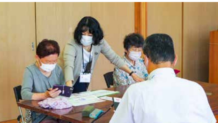
▲6月15日に宮の浦地区で開催した出張スマホ教室の様子