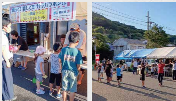
津吉地区まちづくり運営協議会 ☎22-7166