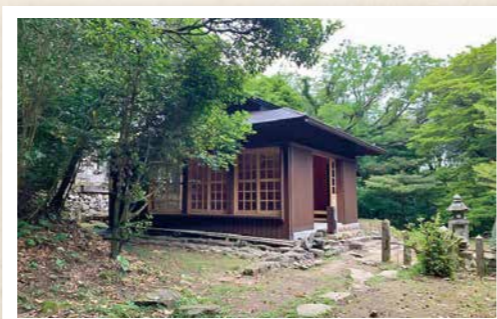
現在の安満岳休憩所