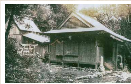
明治時代ごろの白山比賣神社の写真

令和4年度に登山客などが休憩できる便益施設として建物が整備され、白山比賣神社の春と秋の例大祭の時には、平戸神楽の奉納にも利用されています。