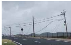
▲台風で断線した電柱