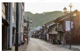
▲無電柱化が完了した地区