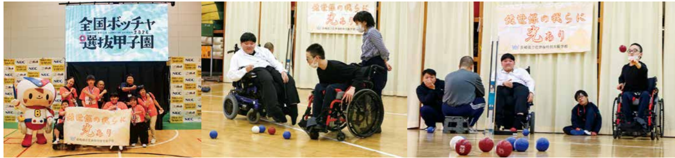
▲イメージキャラクターと記念撮影 ▲チームメイトと作戦を確認 ▲声をかけあいながら試合に臨む