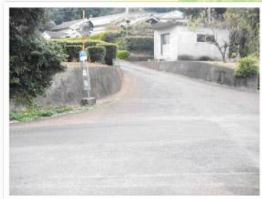
バス停が目印です。