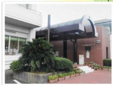
【南部多目的センター】