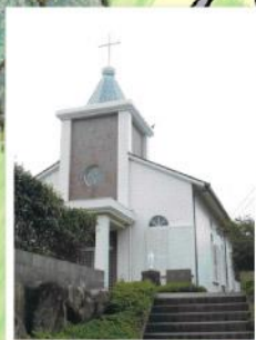
【大佐志カトリック教会】