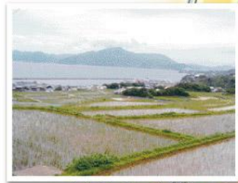
ここからは、生月大橋も見えます。