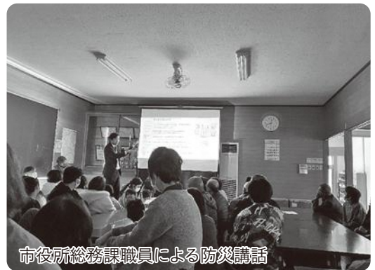
市役所総務課職員による防災講話

講話や地区の活動報告のあとは、レクリエーションも行われており、日用品やお菓子などの賞品を贈るビンゴゲームは、子どもからおじいちゃんおばあちゃんまで大変な盛り上がりとなり、終了予定時刻を大幅に過ぎてしまうことはいつものことだそうです。