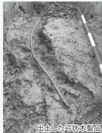
出土した弓状木製品

次に遺物(土器や石器などの持ち運び可能なもの)は、破片等を含む1,768点の遺物が出土しており、全体の5割ほどが縄文、弥生、古墳時代の土器であり、土器の9割が弥生時代中期(2,200年前頃)のものが占めていました。土器以外には、11～14世紀頃の貿易陶磁器片も100点以上あり、他にも石器類では、石鏃(矢じり)や石斧、スクレイパー(へら状のもの)、砥石などが数点ずつ出土しています。また、木製品も出土しており、出土遺物の中でも特に面白いものが弓状の木製品です。木製品は、以前の津吉遺跡の記事でも紹介したように、市内では、里田原遺跡と津吉遺跡のみの出土で、これで3遺跡目になります。弓状木製品が見つかった層は貿易陶磁器片が出土する層であったので、現場でも11～14世紀のものだと判断していましたが、炉跡と同じく実施した放射性炭素年代測定では、1,200年代と測定され、同時に実施した樹種同定では、弓材として用いられることも多かった「カヤ」という結果が出たため、「鎌倉時代に作成されたカヤ製の弓」ということになりました。