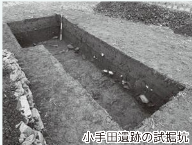
小手田遺跡の試掘坑

調査の結果として、まず、遺構と呼ばれる不動産(家や墓など動かさないもの)の構築物として、試掘坑の最下層(地表面より約1m20cm下)から石で囲われた炉跡が検出されました。炉跡には火を使用した後に残る、被熱を受けて赤くなった石や黒い炭化物がしっかり残されており、炉跡周辺から縄文時代後期～晩期頃の土器片も見つかったため、遺構の構築年代もその時代に近いものと考えられました。また、調査後に遺構の時代を確定するために行った、炭化物を測定試料とした放射性炭素年代測定( ^{14}\text{C} )では、約