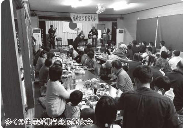
多くの住民が集う公民館大会

田平町の東部に位置する福崎地区は、イチゴや高菜、アスパラなどの畑作農業が盛んな地域です。