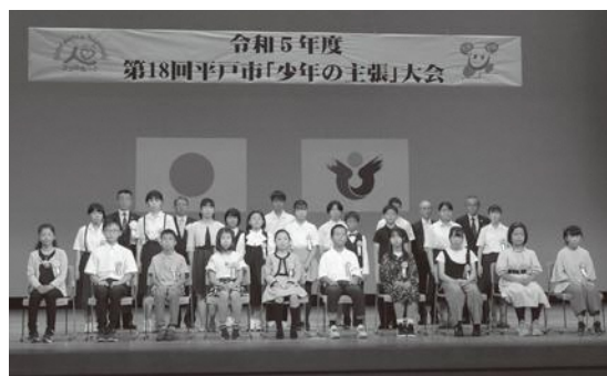
(写真：令和5年度大会)