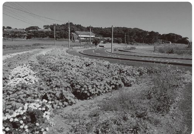
満開のマリーゴールド (今年はコスモスを植える予定)