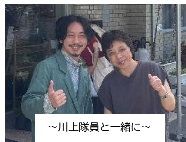
～川上隊員と一緒に～

9月18日(木)～9月19日(金)の日程で開催されたR7年度第1回長崎県地域おこし協力隊研修に参加しました。活動3年間と未来を描く「キャリア・パスポート」の作成は、とても難しい課題でした。グループごとに意見交換や発表を行い、退任後についても考える時間となりました。平戸市以外でも人口が少なく、何をするにもマンパワー不足という課題がある中、郷ノ浦地区のフィールドワークで訪れたあさひ山公園には、地域の人と小学生が協力し合い制作した遊具があり、我が紙漉の里でも、このような取り組みが出来るといいなあと感じました。今後も人脈作りや地域課題を知り、その後の仕事に繋げていけるようにしたいと思います。