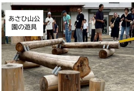
あさひ山公園の遊具