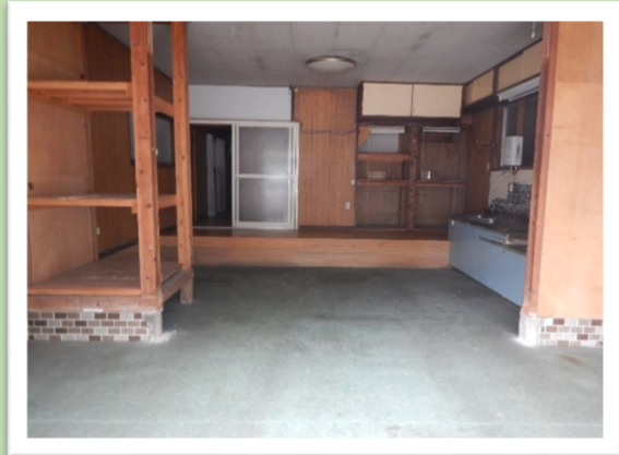
1階：土間コンクリート 1/3