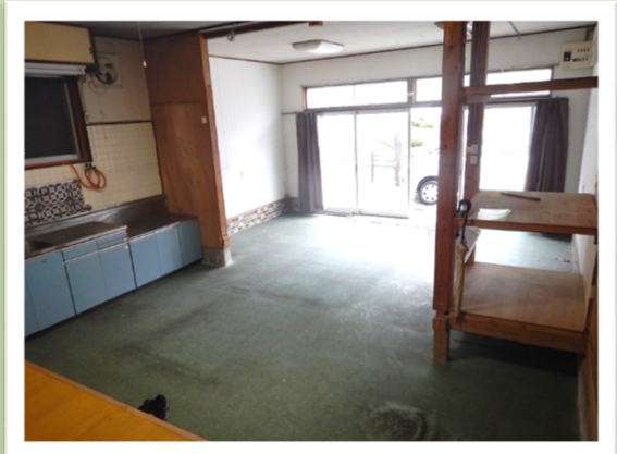
1階：土間コンクリート 2/3