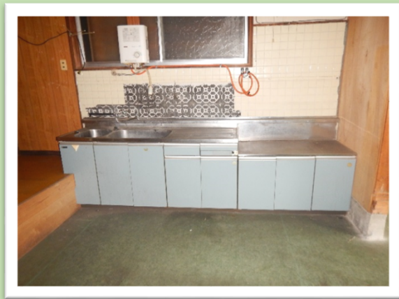
1階:土間コンクリート 3/3