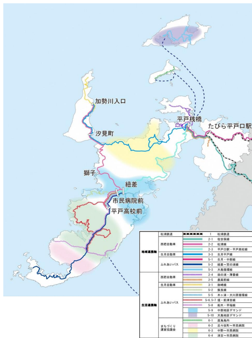
図 8-2 地域連携軸・生活連携軸・航路