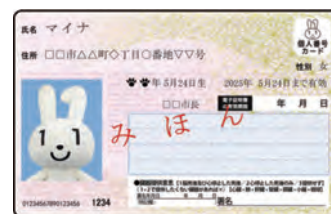
▲マイナンバーカードの見本