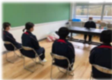
面接練習風景：多くの高校で集団面接が行われる予定です。