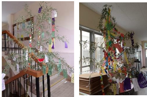
校内には願い事を書いた笹竹を飾っています

68名全員が元気で1学期を終え、笑顔の夏休みを迎えることができるよう学校もがんばります。