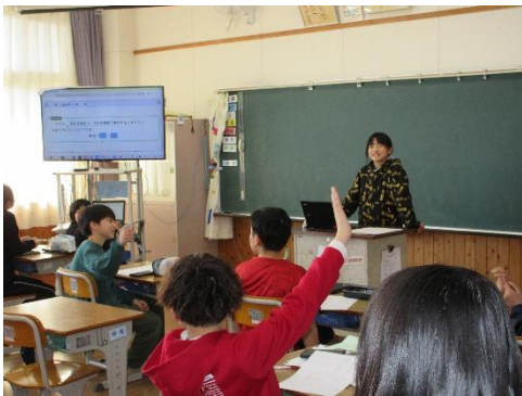
5年 1年間の学習の振り返り