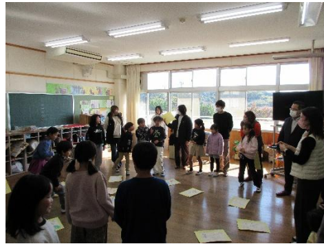
2・3年 1年間の学習の振り返り