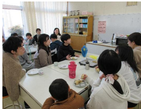
6年 家庭科 いっしょに「ほっとタイム」