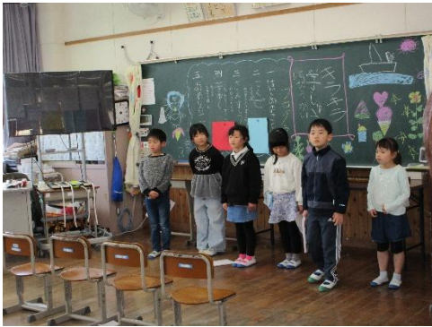
1年 キラキラ学習発表会

2月17日（火）には、今年度、最後の授業参観及び学級懇談会を行いました。今年度、最後の授業参観ということで、それぞれの学年で1年間の学習のまとめの発表を行ったり、4年生は10歳を祝う会を行ったりしましたが、子供たちは、発表の準備などよく頑張っており、日頃の学習の成果をしっかりと見せることができたのではないかと思います。保護者の皆様おかれましては、お忙しい中ご来校いただきありがとうございました。また、学級懇談会後にはPTA評議員会を行いました。度重なる変更で、大変ご迷惑をおかけいたしました。PTA評議員会では、1年間の活動を振り返り、反省を次年度に生かすようにしています。